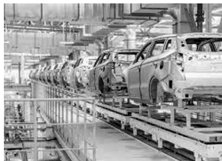
2. Visita a una fábrica de automóviles