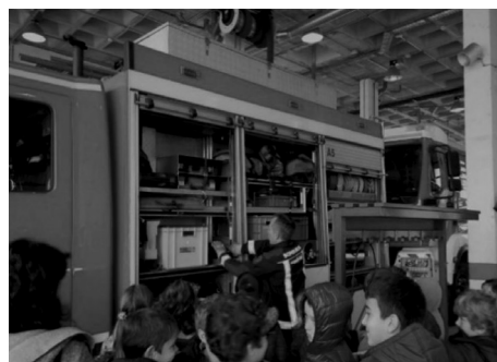
4. Visita al parque de bomberos