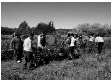
3. Visita a una granja