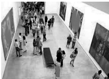
1. Visita a un museo de arte abstracto

La duración de la conversación será de entre cinco y seis minutos.